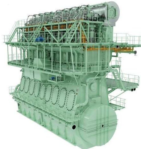
Der Methanolmotor G95ME-LGIM Mk 10.5

Voraussichtliche Einführung des Kraftstoffs in Dual-Fuel-Zweitaktmotoren. Heute machen LNG-betriebene Motoren die überwiegende Mehrheit der Aufträge für Dual-Fuel-Motoren aus, wie im obigen Balkendiagramm in rot dargestellt. Das Interesse an Methanol nimmt zu, und MAN Energy Solutions geht davon aus, dass der Anteil von Methanol an allen Dual-Fuel-Motoren in einigen Jahren auf etwa 30 % steigen wird, wie in dunkelblau gekennzeichnet. Gegen Ende des Jahrzehnts wird erwartet, dass Ammoniak (grün) als Schiffskraftstoff an Bedeutung gewinnt.